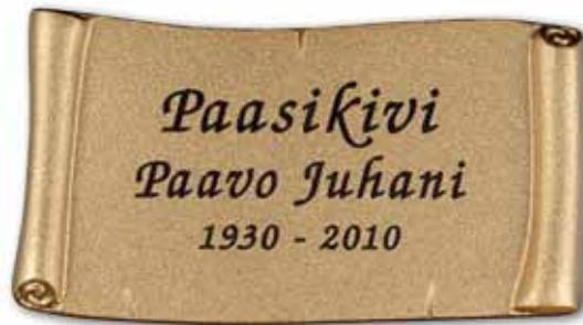
▲ Pohja kirkas, teksti tumma patina

50 x 100 mm 70 x 130 mm 90 x 160 mm 130 x 200 mm 200 x 280 mm