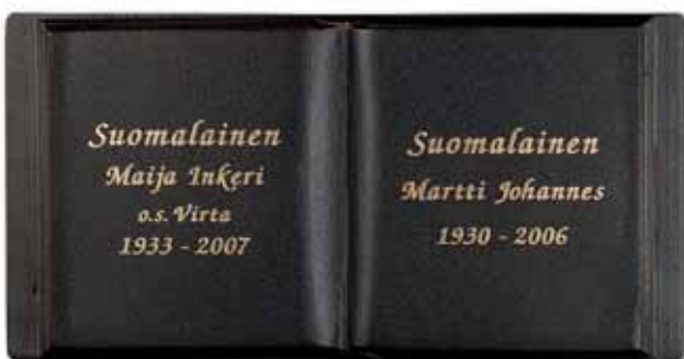
▲ Pohja tumma patina, teksti kirkas