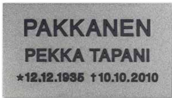
▲ Valettu laatta kohokirjaimin pohja kromattuna, teksti tumma patina, kuvassa kirjaintyyppi Grotoski, ilman kehystä, mahdollinen kehys samansävyinen kuin teksti