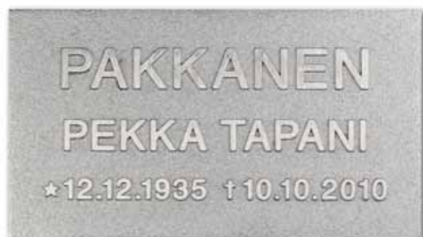
▲ Valettu laatta kohokirjaimin kokonaan kromattuna, ilman kehystä, mahdollinen kehys samansävyinen kuin teksti