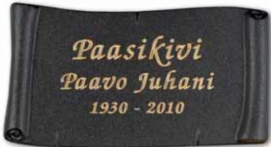
▲ Pohja tumma patina, teksti kirkas, tässä kirjaintyyppi Kursiivi