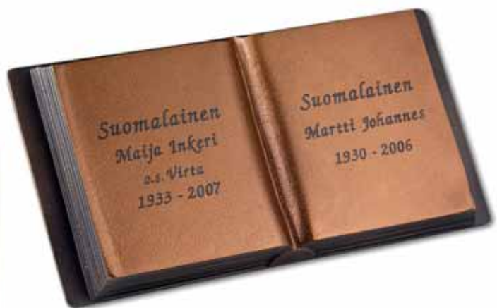
▲ Pohja taidepatina, teksti tumma patina, tässä kirjaintyyppi Kursiivi