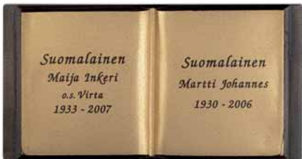
▲ Pohja kirkas, teksti tumma patina