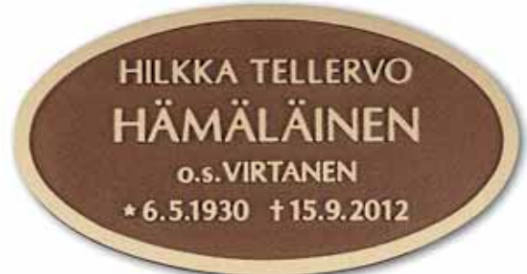
▲ Valettu laatta kohokirjaimin, soikea pohja taidepatina, teksti ja kehys kirkas, kuvassa kirjaintyyppi Optima