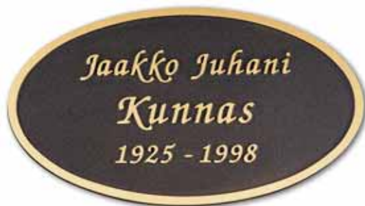
▲ Valettu laatta kohokirjaimin, soikea pohja tumma patina, teksti ja kehys kirkas, kuvassa kirjaintyyppi Kursiivi

► Pohja tumma patina, teksti kirkas, kuvassa kirjaintyyppi Antikva, ilman kehystä