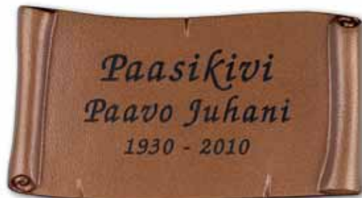
▲ Pohja taidepatina, teksti tumma patina