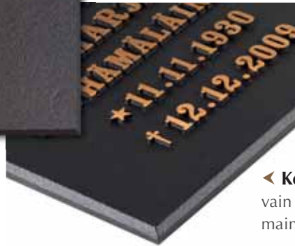
◀ Kohovalettu laatta viistereunoilla vain suorakulmisiin laattoihin, maininta tilatessa