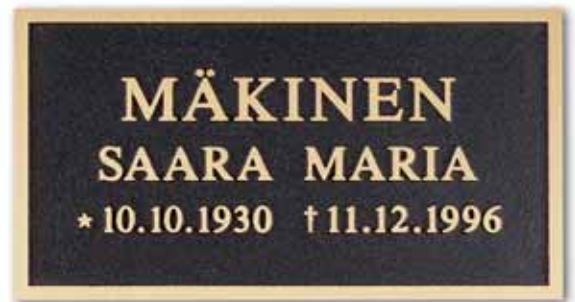
▲ Valettu laatta kohokirjaimin pohja tumma patina, teksti ja kehys kirkas, kuvassa kirjaintyyppi Antikva