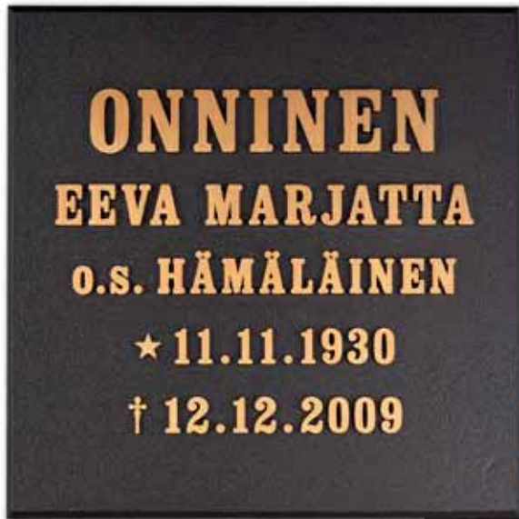
▲ Valettu laatta kohokirjaimin neliönmuotoinen, pohja tumma patina, teksti taidepatina, kuvassa kirjaintyyppi Kapea Antikva