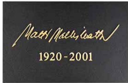
▲ Valettu laatta kohokirjaimin omakätinen nimikirjoitus, aikatiedot Antikvalla, pohja tumma patina, teksti kirkas