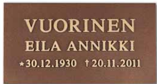
▲ Pohja taidepatina, teksti kirkas, ilman kehystä